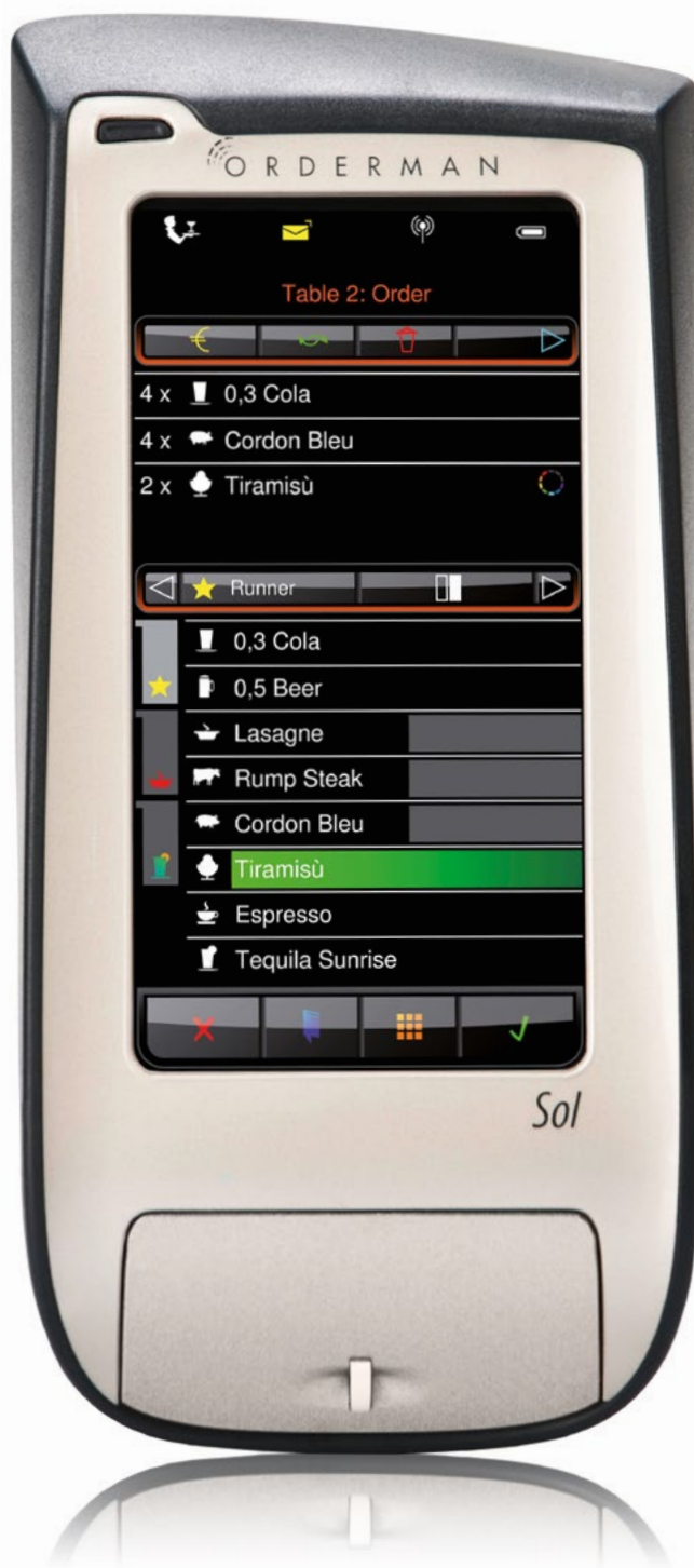
Immagine raffigurante le dimensioni reali

Lunga durata della batteria (fino a 18 ore)