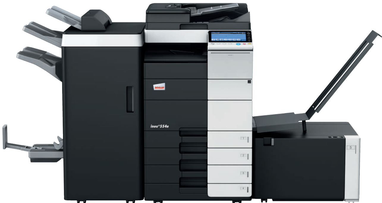
ineo+ 554e con finisher pinzatore (FS-535), kit opuscoli (SD-512), separatore lavori (JS-602), mobiletto con 2 cassette (PC-210), vassoio a grande capacità carta (LU-204) e vassoio porta-banner (BT-C1e)