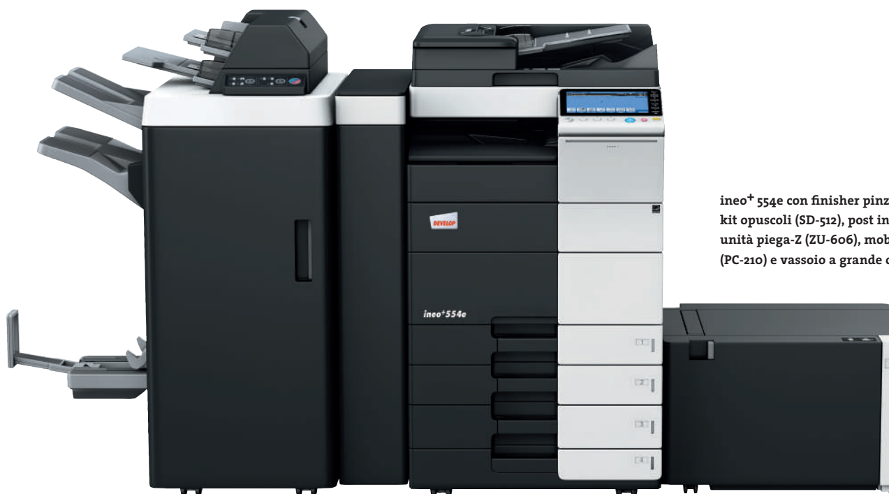
ineo+ 554e con finisher pinzatore (FS-535), kit opuscoli (SD-512), post inseritore (PI-505), unità piega-Z (ZU-606), mobiletto con 2 cassette (PC-210) e vassoio a grande capacità carta (LU-204)

Alcuni sistemi multifunzione per ufficio risultano complessi da utilizzare. ineo+ 454e/554e, viceversa, è molto semplice. Un concetto di funzionamento semplice ed intuitivo assicura una facilità d'utilizzo analoga a quella di uno smartphone o di un tablet. Il display touchscreen capacitivo da 9 pollici è dotato di funzioni note di tipo multi-touch come flick, drag&drop o pinch in&out. Grazie alla nuova struttura di navigazione del menu è possibile visualizzare le funzioni desiderate in simultanea, selezionandole con pochi clic.