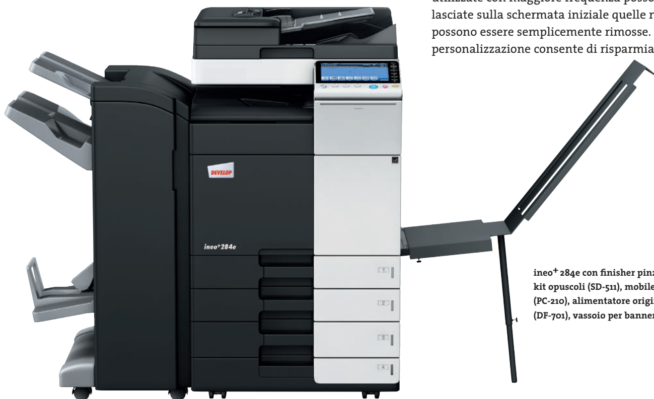
ineo+ 284e con finisher pinzatore (FS-534), kit opuscoli (SD-511), mobiletto con 2 cassette (PC-210), alimentatore originali Dual scan (DF-701), vassoio per banner (BT-C1e)

Molti sistemi multifunzione per ufficio sono complessi da utilizzare. ineo+ 224e/284e/364e, viceversa, è semplicissima. Un concetto di funzionamento semplice e intuitivo assicura una facilità d'utilizzo analoga a quella di uno smartphone o di un tablet. Il touchscreen capacitivo da 9 pollici è dotato di funzioni note come flick&drag e grazie a una nuova struttura di navigazione del menu è possibile visualizzare tutte le funzioni contemporaneamente e selezionare le impostazioni desiderate con pochi clic. Le funzioni utilizzate con maggiore frequenza possono essere lasciate sulla schermata iniziale quelle non utilizzate possono essere semplicemente rimosse. Questo tipo di personalizzazione consente di risparmiare tempo.