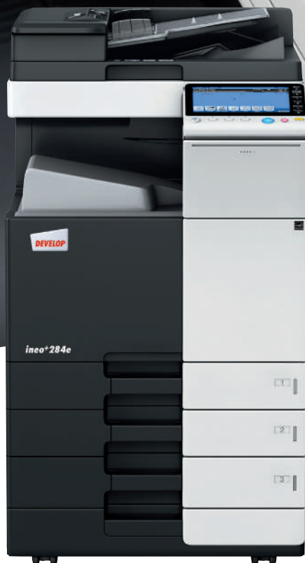
ineo+ 284e con mobiletto con cassetto da 500 fogli (PC-110) e alimentatore originali Dual scan (DF-701)