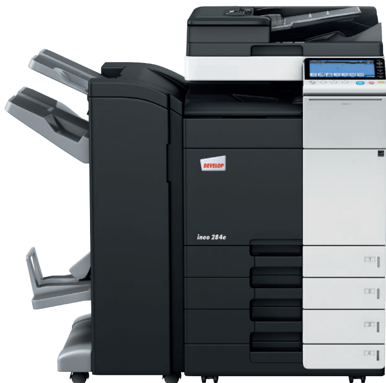
ineo 284e con alimentatore originali dual scan (DF-701), finisher pinzatore da 50ff con kit opuscoli integrato (FS-534SD) e mobiletto con 2 cassette carta (PC-210)

Ogni sistema multifunzione office – ineo 224e, ineo 284e e ineo 364e – non è solo eccezionalmente semplice da usare, ma offre anche un'ampia gamma di funzioni in grado di facilitare l'attività quotidiana tipica di ogni ufficio. Risparmiando tempo nei lavori di stampa, copia o scansione, gli utenti saranno aiutati a svolgere al meglio il proprio lavoro, e anche la produttività ne avrà un beneficio.