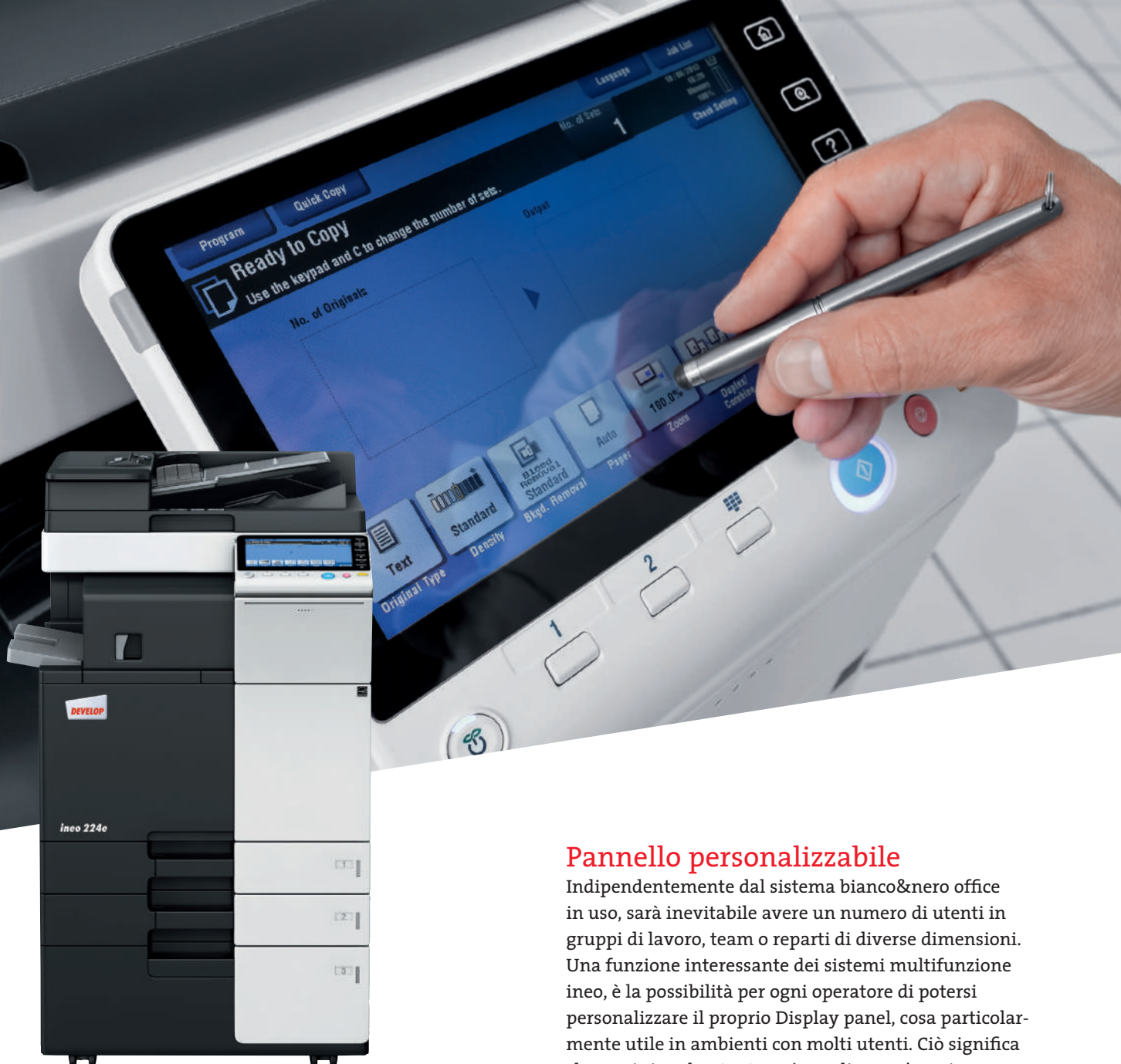
ineo 224e con alimentatore originali duplex (DF-624), inner Finisher (FS-533) e mobiletto ad alta capacità carta (PC-410)