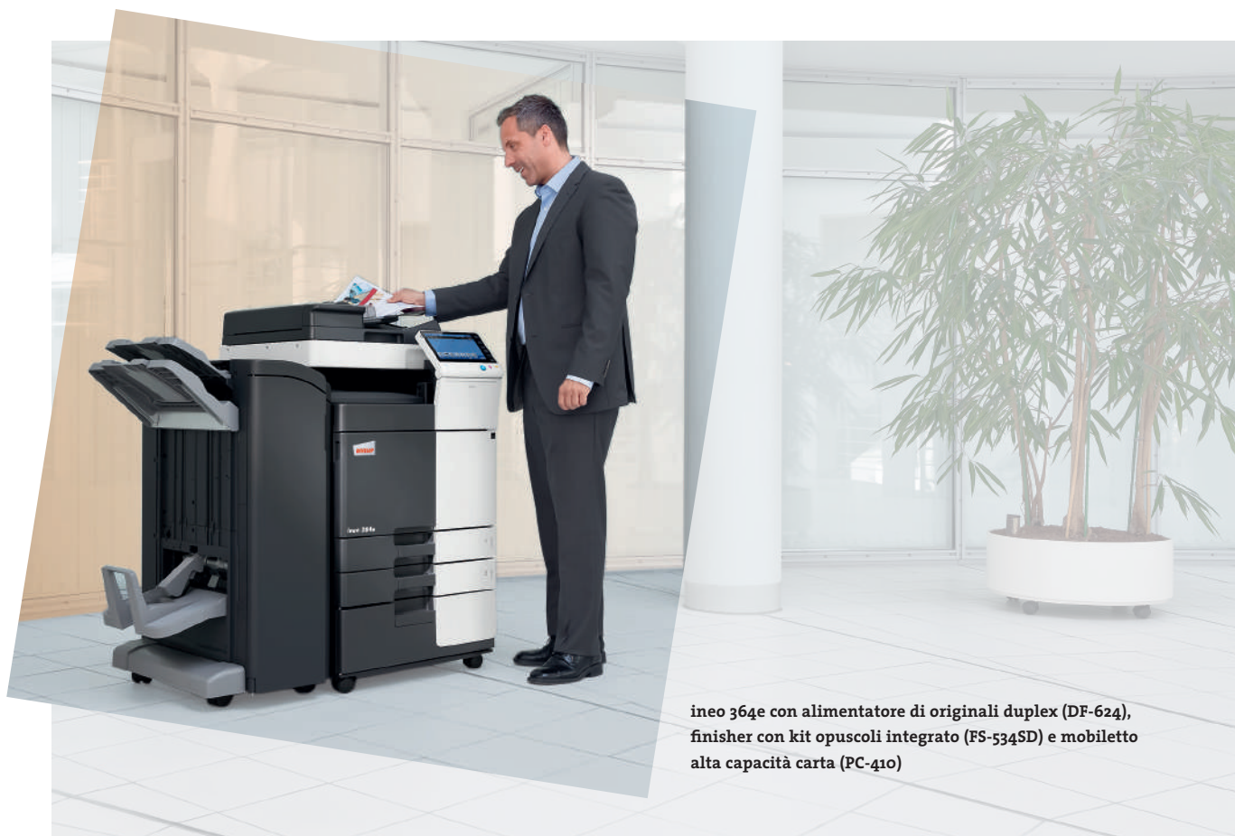
ineo 364e con alimentatore di originali duplex (DF-624), finisher con kit opuscoli integrato (FS-534SD) e mobiletto alta capacità carta (PC-410)

Questi sistemi in monocromia offrono numerose funzionalità energy-saving che permettono di tagliare l'assorbimento energetico fino al 40% se comparati con i modelli precedenti. Mentre questo tipo di economia aiuta a risparmiare denaro, altre funzioni "green" consentono benefici dal punto di vista ecologico. Ciò significa che la gamma DEVELOP ineo non solo salvaguarda l'ambiente ma è in grado di incrementare le credenziali "green" di chi la utilizza.