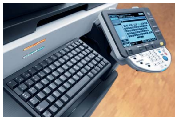
Display touch screen a colori e tastiera opzionale di ineo 223

Una squadra perfetta. I sistemi ineo 223/283 offrono grandi vantaggi per tutte le attività di stampa e copiatura in bianco e nero; i sistemi ineo+ a colori garantiscono invece una stampa a colori professionale: una combinazione conveniente per la produzione di documenti aziendali di alta qualità.