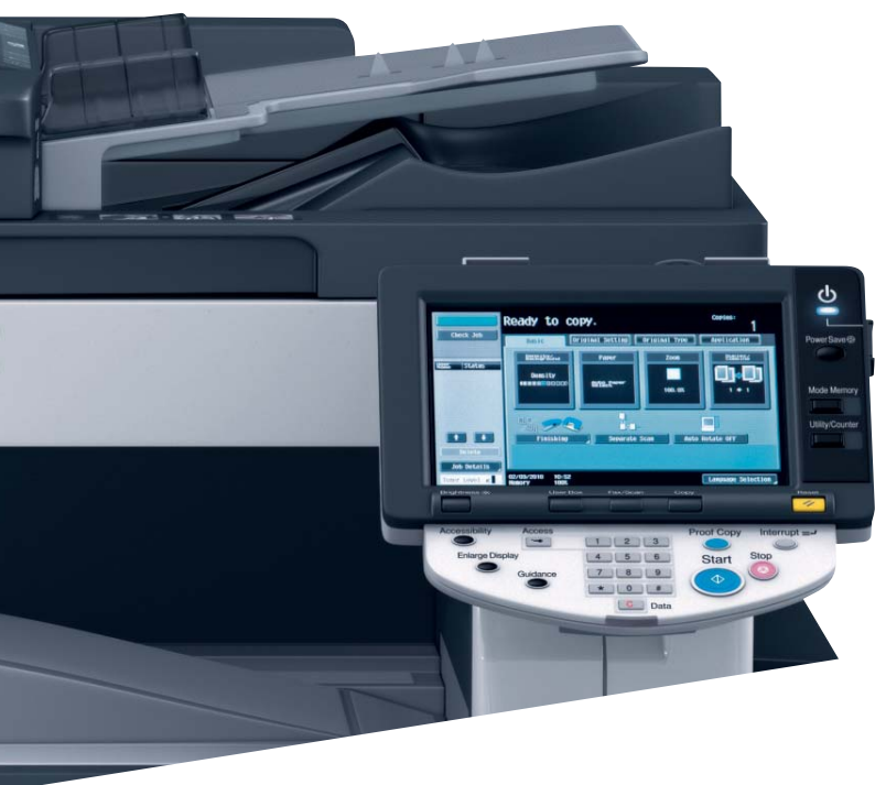
Display touch screen a colori di ineo 223, semplice da utilizzare

L'elevata qualità di stampa, unita a una vasta gamma di funzioni di finitura, consente la stampa interna di documenti aziendali professionali, come per esempio brochure. Se si aggiungono anche le funzioni di bucatura e pinzatura, la produttività dell'ufficio sarà ancora maggiore.