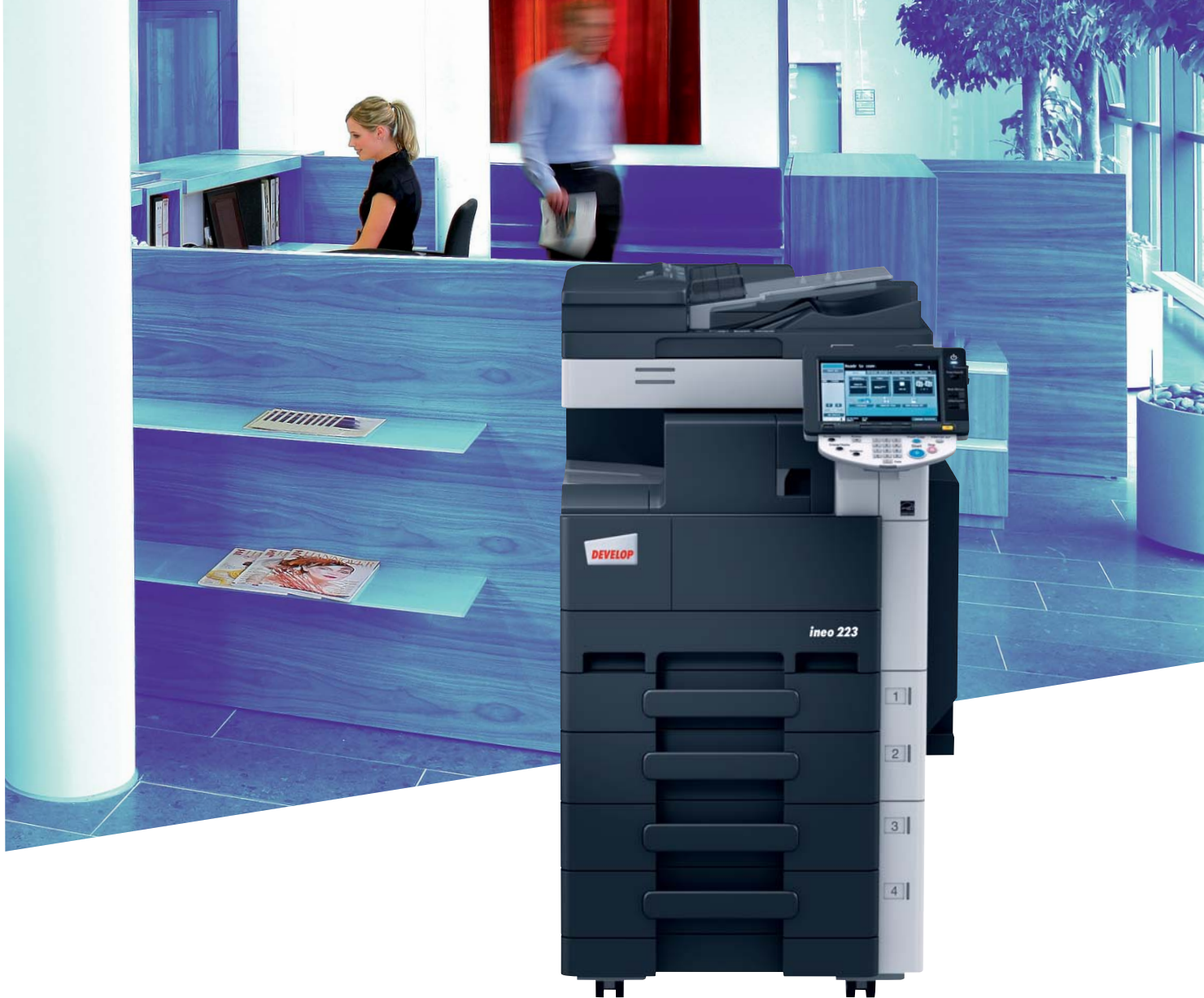
ineo 223 con finisher incorporato (FS-529), cassetto carta (PC-208) e alimentatore originali (DF-621)