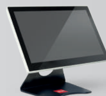
peso 4960 g