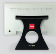
Largo 390 mm