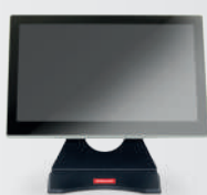
Alto 324 mm

Atos 15M una soluzione esclusiva per la gestione del punto cassa.