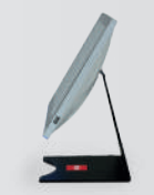
Profondo 180 mm